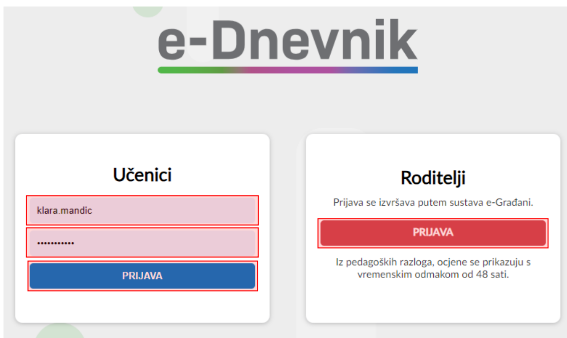
Slika 1 Sučelje za prijavu učenika i roditelja

Nakon prijave u sustav učenici i roditelji trebaju odabrati razredni odjel za koji žele pregledavati podatke.